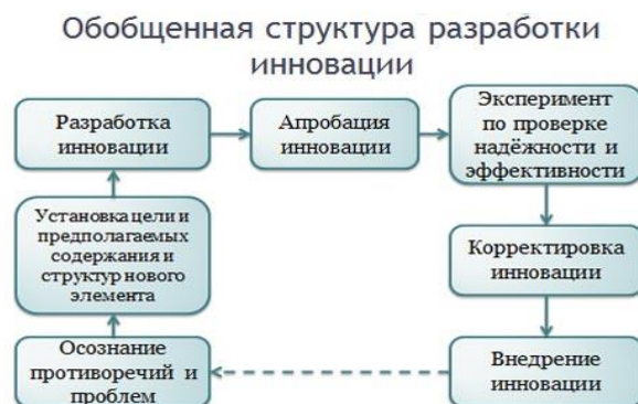
Рисунок 1 – Обобщенная структура разработки инновации.

На теоретико-методологическом уровне наиболее фундаментально проблема нововведений отражена в работах М.М. Поташника, А. В Хуторского, Н Б Пугачёвой, В.С. Лазарева, В.И Загвязинского с позиций системно-деятельностного подхода, что дает возможность анализировать не только отдельные стадии инновационного процесса, но и перейти к комплексному изучению нововведений. Обобщенная структура разработки инновации в любой сфере представлена на рисунке 1: